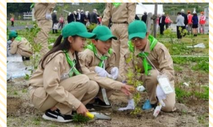
植樹行事の様子

県内の子どもたちに広く参加していただき、森林整備や森林資源の循環利用への理解を深めてもらうとともに、全国植樹祭の開催機運を高めることを目的として実施します。