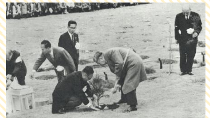
第17回全国植樹祭の様子 (前回の愛媛県開催)

愛媛県では、令和8年春に、60年ぶり2回目となる「第76回全国植樹祭えひめ2026」を開催します。