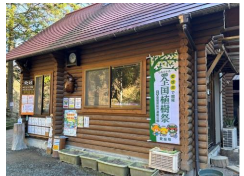
えひめ森林公園 管理棟