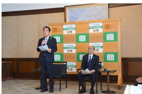
共同記者会見（令和5年11月28日（火曜日））