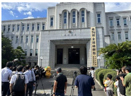
開催県決定のPR（令和5年8月8日（火曜日））