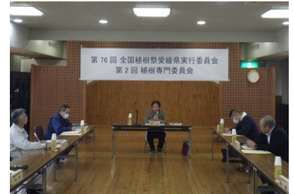
植樹専門委員会の様子