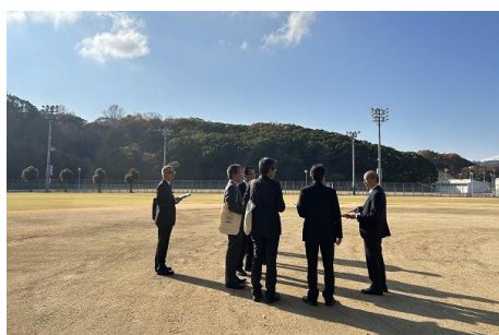
現地調査（令和5年11月27日（月曜日））