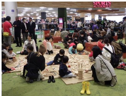
木育キャラバンの様子