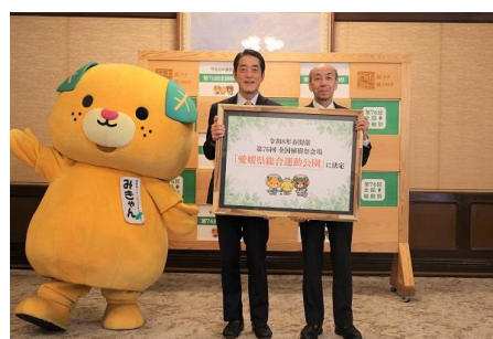
記念写真撮影（令和5年11月28日（火曜日））