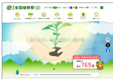
HP デザインイメージ①