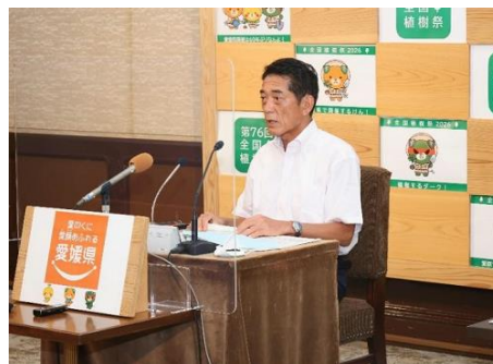
定例記者会見（令和5年8月10日（木曜日））