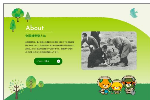
HP デザインイメージ②