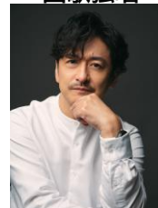
石丸 幹二 さん (俳優・歌手)