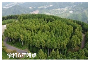
式典会場(松山市久谷町 久谷ふれあい林)の移り変わりの様子