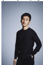
草薨 剛 さん (俳優・歌手・タレント)