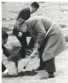
天皇皇后両陛下によるお手植え