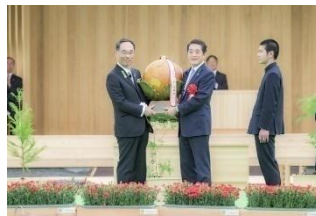
リレーセレモニー